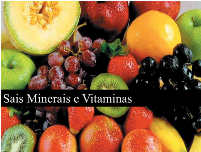
Sais Minerais e Vitaminas

Niacina: ou vitamina B3 atua na nutrição do couro cabeludo e estimula o crescimento saudável dos fios, ela age diretamente na prevenção da queda capilar e no fortalecimento do cabelo.