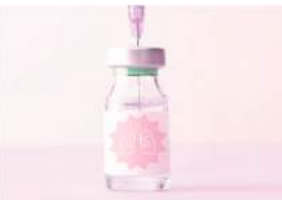
Vacina contra vírus sincicial respiratório resguarda os pulmões

Imunizante deve começar a ser distribuída no SUS em novembro O Ministério da Saúde anunciou, nesta quarta-feira (10), uma parceria de transferência de tecnologia entre o Instituto Butantan e a farma-cêutica Pfizer para a produção nacional da vacina contra o vírus sincicial respiratório (VSR), uma das principais causas de infecções respiratórias graves em bebês, incluindo quadros de bronquiolite. A previsão é que as primeiras 1,8 milhão de doses sejam entregues até o fim deste ano. Em fevereiro, a pasta já havia confirmado a incorpo-ração do imunizante ao Sistema Único de Saúde (SUS). Com o acordo, a distribuição da vacina contra o VSR na rede pública, para gestantes e bebês, deve começar na segunda quinzena de novembro. Devem ser imunizadas, por meio de dose única, gestantes a partir da 28ª semana de gravidez. A vacinação materna, segundo o ministério, favo-rece a transferência de anticorpos para o bebê, contribuindo para a proteção nos primeiros meses de vida, período de maior vulnerabilidade ao VSR.